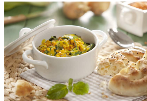
Mangold Linsentopf

pflanzlichen und saisonalen Zutaten günstig auf die CO2-Bilanz aus. Neben heimischen Menüs, wie zum Beispiel „Gemüsevariation im Pergament-Bonbon mit Kartoffelchen und Kerbel-Dip“ oder „Mangold-Linsen-Topf mit Melisse“, werden auch Rezepte aus aller Welt gekocht – darunter ein marokkanischer Rosinen-Couscous mit Mandel-Spinat.